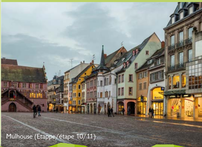
Mulhouse (Etappe/étape 10/11)

Länge/distance: 34,4 km / 8 h Start/début: Mulhouse (F) Ziel/fin: Neuenburg a.R. (D) Info: www.neuenburg.de