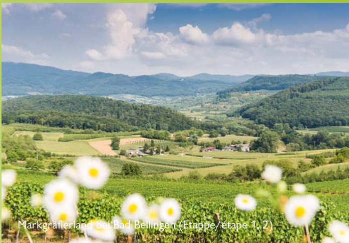
Markgräflerland bei Bad Bellingen (Etappe/étape 1, 2)