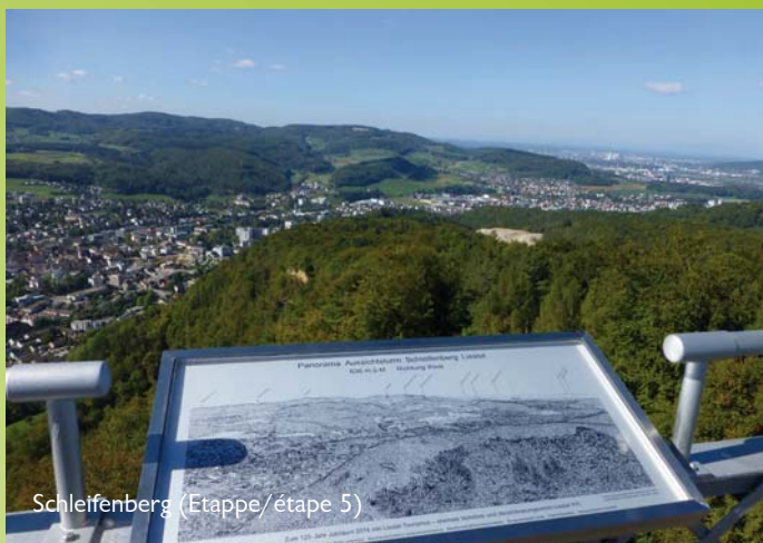
Schleifenberg (Etappe/étape 5)