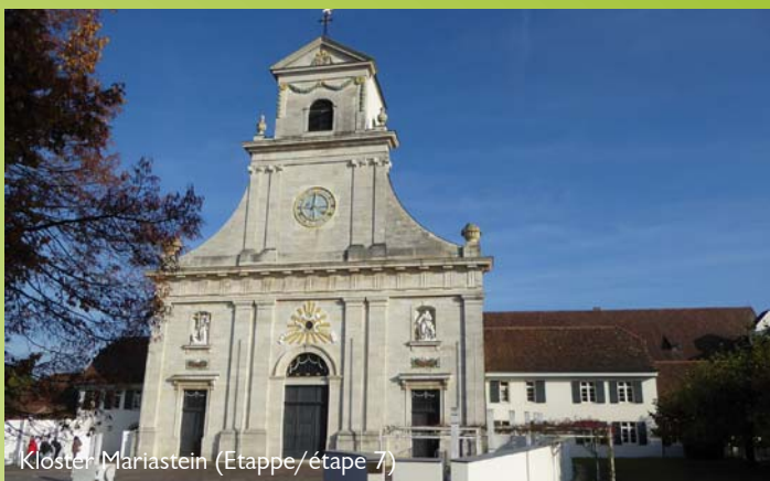
Kloster Mariastein (Etappe/étape 7)